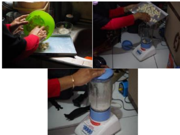
Gambar 1. Dokumentasi Proses Pengolahan Tepung Singkong

Penulis telah melampirkan sejumlah dokumentasi terkait kegiatan pengolahan ulang bahan residu singkong yang digunakan untuk mengolah keripik kaca Akopa. Kumpulan dokumentasi akan dijabarkan dalam gambar berikut: