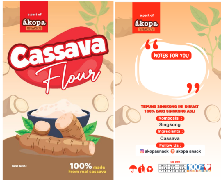
Gambar 4. Kemasan Tepung Singkong

Hasil produk tepung yang telah diolah kemudian dikemas dalam kemasan untuk menempuh proses distribusi kepada konsumen. Kemasan tepung olahan singkong telah didesain dalam gambar berikut: