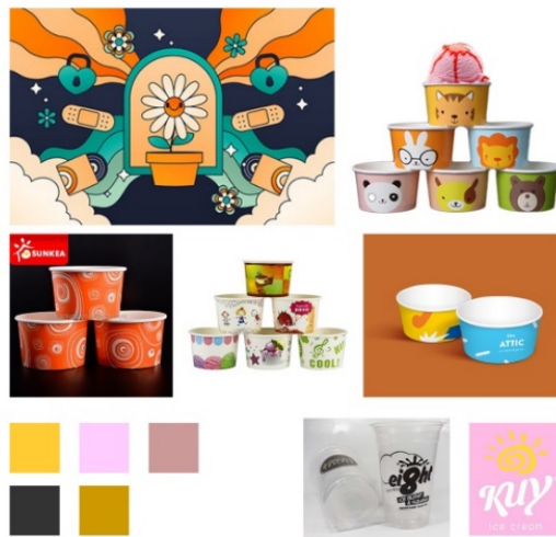
Gambar 4.1 Moodboard

Peran moodboard yaitu Meningkatkan pemahaman serta kepercayaan dari konsumen terhadap produk yang akan dirancang. Memberikan gambaran yang akan datang mengenai tujuan dan manfaat dari karya yang akan dibuat. Merumuskan berbagai macam ide yang semula bersifat abstrak menjadi sebuah desain karya yang konkret. Dibawah ini adalah moodboard yang akan dirancang untuk brand kedepannya.