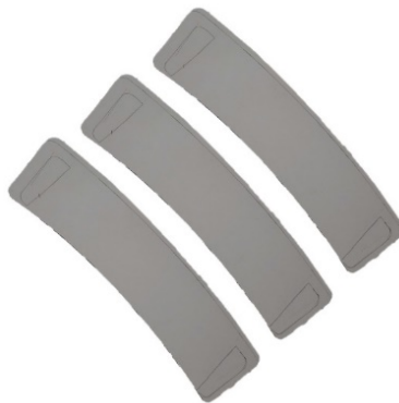
Gambar. 4.2 Pola Kemasan

Setelah moodboard, dilanjutkan dengan membuat pola untuk di aplikasikan pada kemasan dengan ukuran diameter lingkaran 23cm x 20,5 cm. Ditambahkan pola untuk pegangan agar anak-anak bisa dengan mudah membawanya.