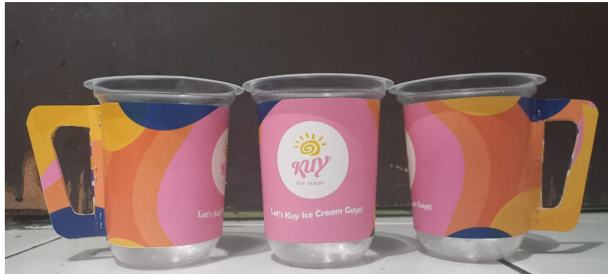
Gambar 4.9 Hasil Akhir

Hasil cetak ini merupakan kemasan sekunder, Kemasan sekunder adalah kemasan yang ada di luar kemasan utama dan berfungsi untuk melindungi produk dari dunia luar. Kemasan sekunder juga digunakan sebagai bagian dari branding produk dan pemasaran produk yang menarik. Produk ini dilapisi desain ilustrasi dekoratif dengan ditambahkan pegangan pada gelasannya untuk mempermudah anak-anak dalam membawanya.