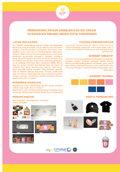
Gambar 4.10 Poster A2