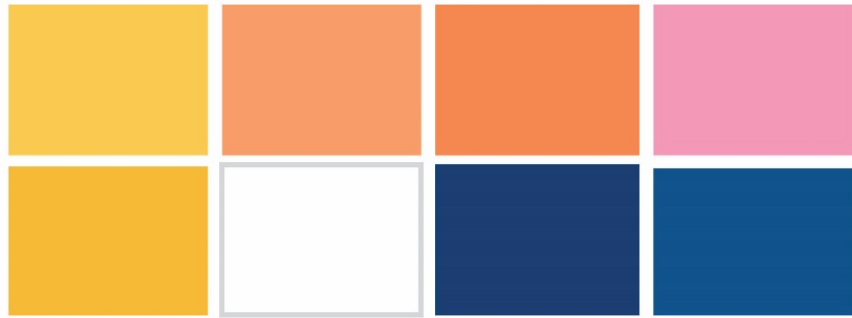
Gambar 4.7 Warna

Warna dapat mempengaruhi perasaan konsumen. Pada perancangan ini, perancangan warna disesuaikan dengan identitas desain kemasan kuy ice cream yang diberikan. Seperti contoh warna merah jambu sebagai warna yang memiliki kesan bahagia, santai, dan juga semangat baru. Dibawah ini adalah warna yang dipakai dalam perancangan desain kemasan.