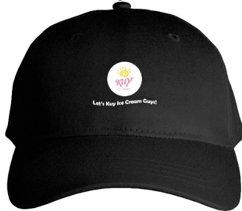
Gambar 4.12 Topi