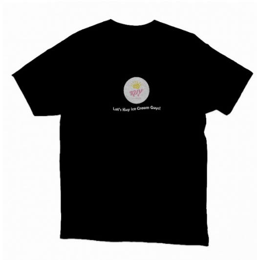
Gambar 4.11 T-Shirt