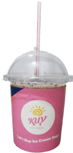
Gambar 4.17 Ikon Besar