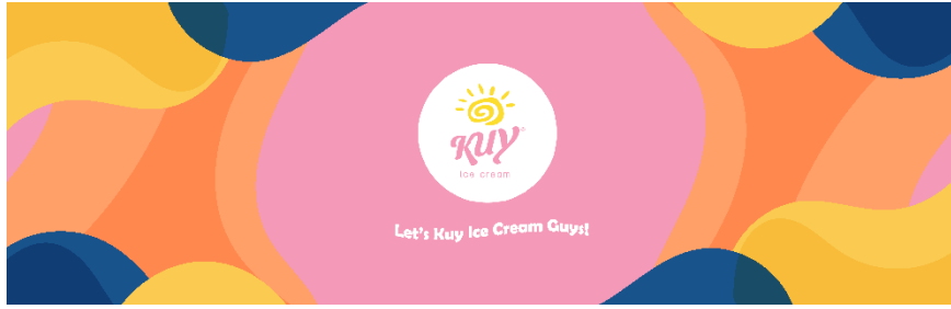
Gambar 4.5 Ilustrasi

Peran ilustrasi sendiri banyak digunakan di media retail dan promosi, sehingga akan memberikan dampak visual terkait dengan informasi dan promosi dari sebuah brand atau kemasan. Pada perusahaan, ilustrasi sering dimanfaatkan untuk menggambarkan sebuah tema yang abstrak seperti produk-produk yang akan dijual ke konsumen. Dengan adanya ilustrasi akan membuat sebuah brand kemasan lebih menarik dan dapat meningkatkan ketertarikan pada konsumen, khususnya pada kemasan anak-anak.