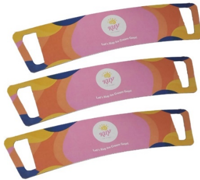
Gambar 4.8 Hasil Cetak