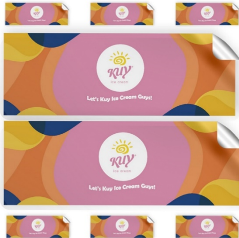
Gambar 4.15 Sticker