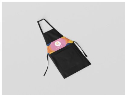
Gambar 4.13 Apron