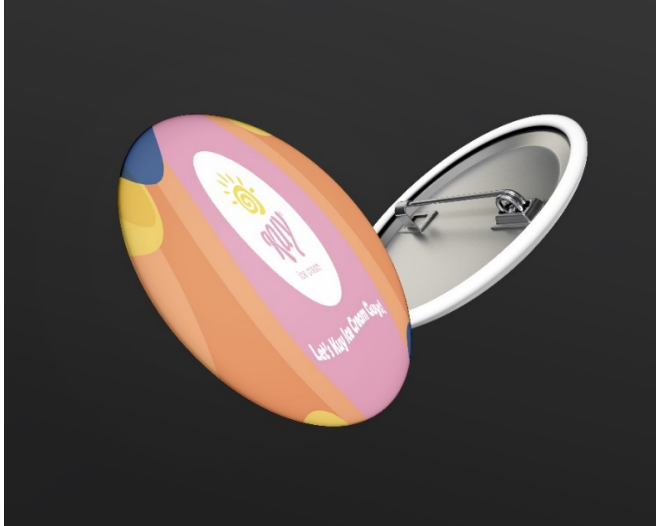
Gambar 4.16 Pin