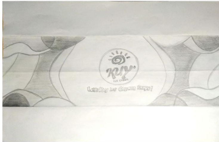
Gambar 4.3 Sketsa