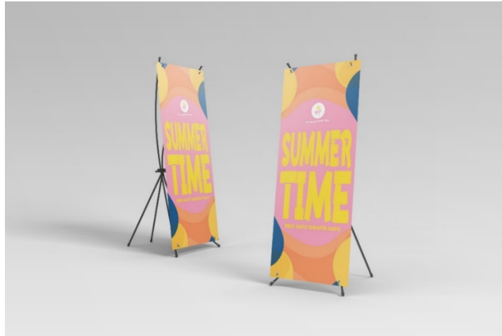
Gambar 4.14 X Bannner