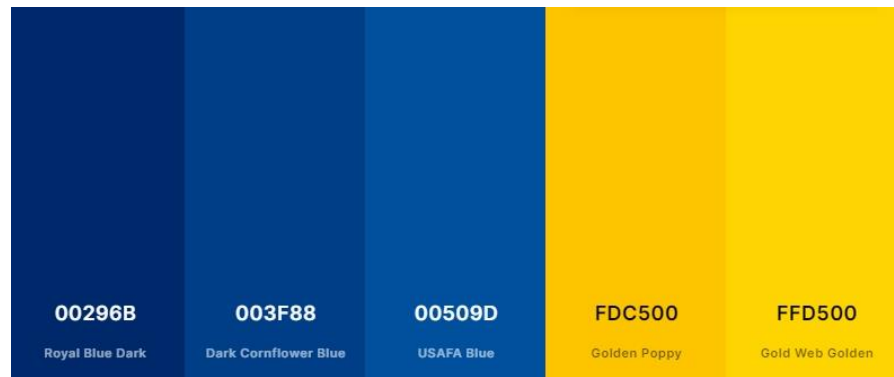
Gambar 2. 2 Warna (Sumber: dafont.com)