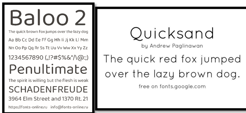
Gambar 2. 1 Font

Dapat disimpulkan bahwa pemilihan tipografi yang tepat, seperti font membulat dengan jarak antarthuruf cukup atau font sans-serif sederhana, berperan penting dalam meningkatkan keterbacaan, khususnya bagi anak-anak dan pembaca muda.