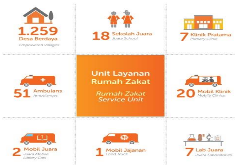
Gambar 2. Unit Layanan Rumah Zakat

RZ mempunyai Unit Layanan yang begitu memadai sebagaimana disajikan pada Gambar 2. Jumlah Desa Berdaya sebagai master piece program dengan konsep ICD nya mencapai 1.259 Desa. Selain itu, RZ menyediakan 18 Sekolah Juara (bidang pendidikan), 7 Klinik Pratama (bidang kesehatan), 51 Ambulance, 20 Mobul Klinik, 7 Lab Juara, 1 Mobil Jenazah dan 2 Mobil Juara.