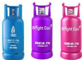
Gambar 1. O Gas

Semakin berkembangnya gas elpiji membuat pekerjaan semakin banyak dan juga memakan waktu lama dalam proses pendataan pelanggan, pendataan gas elpiji, transaksi penjualan, pengembalian dan sebagainya. Jika menambah karyawan maka akan semakin banyak koordinasi dan memakan biaya yang cukup banyak. Untuk menghemat biaya dan untuk mengefisiensi waktu dalam perkembangan perusahaan kedepan maka dirancang sistem informasi yang dapat mengatasi permasalahan-permasalahan yang terjadi.