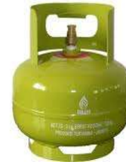
Gambar 3. Tabung Gas

keperluan rumah tangga yang akhir-akhir ini sulit untuk di beli. Pergi ke penjual 1, 2, bahkan lebih, sering kali tidak ada atau sudah habis. Apalagi harus membawa tabung yg cukup berat.