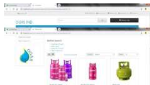
Gambar 4.Desain Menu