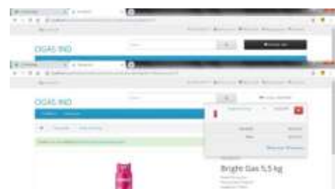
Gambar 5.Desain Menu