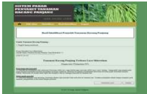
Gambar 3. Tampilan Hasil Identifikasi Penyakit Tanaman Kacang Panjang

Pada tampilan form identifikasi penyakit tanaman kacang panjang terdapat pertanyaan-pertanyaan gejala tanaman kacang panjang yang akan diisi oleh user untuk menentukan jenis penyakit tanaman kacang panjang user sesuai dengan gejala yang dialami oleh tanaman kacang panjang.