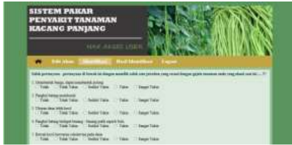
Gambar 2. Tampilan Identifikasi Penyakit Tanaman Kacang Panjang

Pada tampilan form identifikasi penyakit tanaman kacang panjang terdapat pertanyaan-pertanyaan gejala tanaman kacang panjang yang akan diisi oleh user untuk menentukan jenis penyakit tanaman kacang panjang user sesuai dengan gejala yang dialami oleh tanaman kacang panjang.