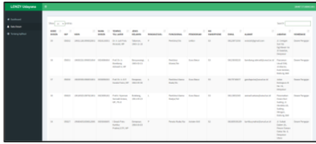
Gambar 10. Antarmuka halaman data dosen pengguna user

Kuisisioner digunakan untuk mengetahui apakah sistem yang dikembangkan dapat mempermudah pengelolaan data dosen di Fakultas 10 knologi Pertanian Universitas Udayana. Rancangan kuisisioner yang dibuat adalah kuisisioner tertutup, dimana jawaban 32 atasi atau sudah ditentukan. Kuisisioner menggunakan skala likert dengan 10 pernyataan sebagai berikut: