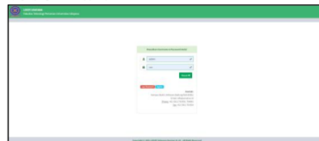
Gambar 7. Antarmuka form login

Berikut adalah tampilan antarmuka sistem pengelolaan data dosen LOVZY UDAYANA Version 21.01.