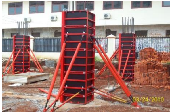
Gambar 5. Aplikasi Bekisting LICO untuk bangunan rendah

Jika dilihat pada tabel, bisa dilihat bahwa pada tahun 2011, bekisting LICO dengan konsep man handling mempunyai produksi yang sangat tinggi dibandingkan dengan produksi pada tahun 2010 dan 2012.