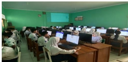
Gambar 2: Siswa Menerapkan Media Canva Flipbook

Dengan demikian, dapat disimpulkan bahwa penggunaan media pembelajaran dengan Canva Flipbook dalam materi menulis narasi di kelas VII.9 SMP Negeri 5 Pasarkemis telah memberikan pengaruh positif yang signifikan terhadap pembelajaran siswa. Media ini tidak hanya meningkatkan partisipasi dan keterlibatan siswa, tetapi juga mendorong perkembangan sejumlah sikap positif, seperti kolaborasi, kreativitas, dan partisipasi aktif dalam proses belajar mengajar. Keberhasilan penerapan ini mengindikasikan bahwa media digital berbasis Canva Flipbook dapat menjadi alternatif yang efektif dalam penerapan Kurikulum Merdeka, yang menekankan pembelajaran yang berorientasi pada siswa. Temuan penelitian ini juga menunjukkan bahwa penggunaan media digital dapat menciptakan suasana pembelajaran yang lebih interaktif dan kolaboratif serta mendukung siswa dalam menghasilkan proyek dan meningkatkan kemampuan berpikir kritis serta kreatif. Dengan fleksibilitas yang ditawarkan oleh media ini, siswa memiliki kebebasan yang lebih besar dalam mengekspresikan ide tanpa terhambat oleh keterbatasan teknis yang sering dihadapi dalam metode konvensional.