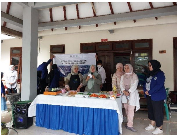
Gambar 3 dan 4. Tim pendamping memberikan pengarahan sebelum melakukan demonstrasi memasak sambal bakar.

Setelah edukasi tersebut warga Desa Benjor yang didampingi oleh tim pelaksana memberikan demonstrasi mengenai cara memasak dan melakukan pengemasan yang baik agar kedepannya masyarakat mampu mengelola usaha tersebut dengan nilai jual yang tinggi serta dapat dikenal oleh khalayak, baik dari skala regional sampai nasional agar sesuai dengan salah satu tujuan dari ekonomi kreatif yang tercantum dalam Undang-Undang Nomor 24 tahun 2019 (Pusat, 2019).