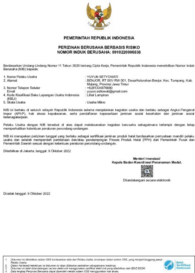
Gambar 5. Nomor Izin Berusaha (NIB) UMKM Sambal Bakar Pawon Benjor

Akun Instagram sebagai media promosi dirancang untuk menarik perhatian konsumen. Promosi yang demikian adalah hal yang harus dilakukan pihak-pihak pemilik usaha. Di dalam bentuk promosi yang terdapat di akun media sosial Sambal Bakar Khas Pawon Benjor adalah pesan-pesan persuasif yang efektif. Hal ini dilakukan dengan tujuan untuk menarik perhatian konsumen. Akun media sosial yang dapat diakses masyarakat luas untuk produk sambal bakar adalah akun Instagram yang bernama @pawonbenjor.id. Menurut (Puspitarini & Nuraeni, 2019) akun media sosial Instagram tidak hanya berisi tentang hiburan semata, melainkan memiliki potensi dalam mengupayakan kegiatan masyarakat berupa usaha bisnis.