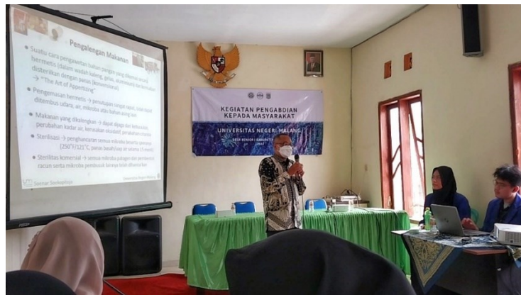
Gambar 2. Pemateri menjelaskan tentang pengalengan makanan

Setelah edukasi tersebut warga Desa Benjor yang didampingi oleh tim pelaksana memberikan demonstrasi mengenai cara memasak dan melakukan pengemasan yang baik agar kedepannya masyarakat mampu mengelola usaha tersebut dengan nilai jual yang tinggi serta dapat dikenal oleh khalayak, baik dari skala regional sampai nasional agar sesuai dengan salah satu tujuan dari ekonomi kreatif yang tercantum dalam Undang-Undang Nomor 24 tahun 2019 (Pusat, 2019).