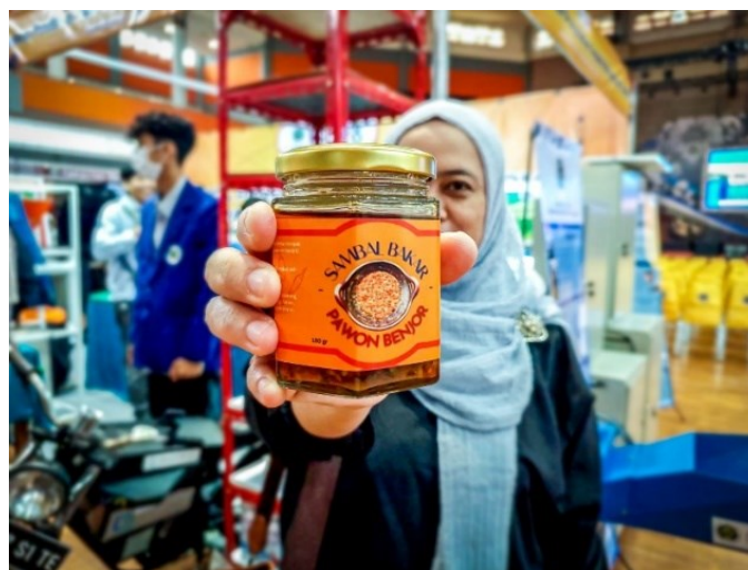
Gambar 7. Produk Sambal Bakar yang dijual pada event Dies Natalis Universitas Negeri Malang ke-68

Produk UMKM Sambal Bakar Pawon Benjor juga diikutsertakan dalam pameran Dies Natalis Universitas Negeri Malang ke-68, sehingga produk UMKM ini sudah mulai dikenal oleh masyarakat luas dan mendapatkan respon positif dari para pelanggan. Ekonomi kreatif perlu dikembangkan disini. Ekonomi kreatif tidak hanya menciptakan nilai tambah secara ekonomi namun juga nilai tambah secara sosial, budaya dan lingkungan (Nandini, 2016)