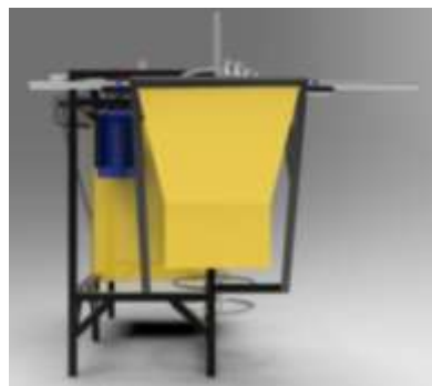
Gambar 3. Mesin Pengolah Buah Bereuk ( Gambar Kanan)