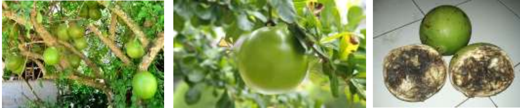
Gambar 1. Buah Berenuk

asing dengan buah berenuk ini . Sebab buah yang mirip-mirip dengan buah Maja ini (buah Maja : konon nama buah ini menjadi asal mula nama kerajaan Majapahit) memang dijadikan sebagai maskot Kabupaten Mojokerto.Sedangkan buah Maja dijadikan sebagai maskot kota Mojokerto.Tetapi bagi yang bermukim di wilayah lain mungkin masih agak asing, apa itu buah berenuk.